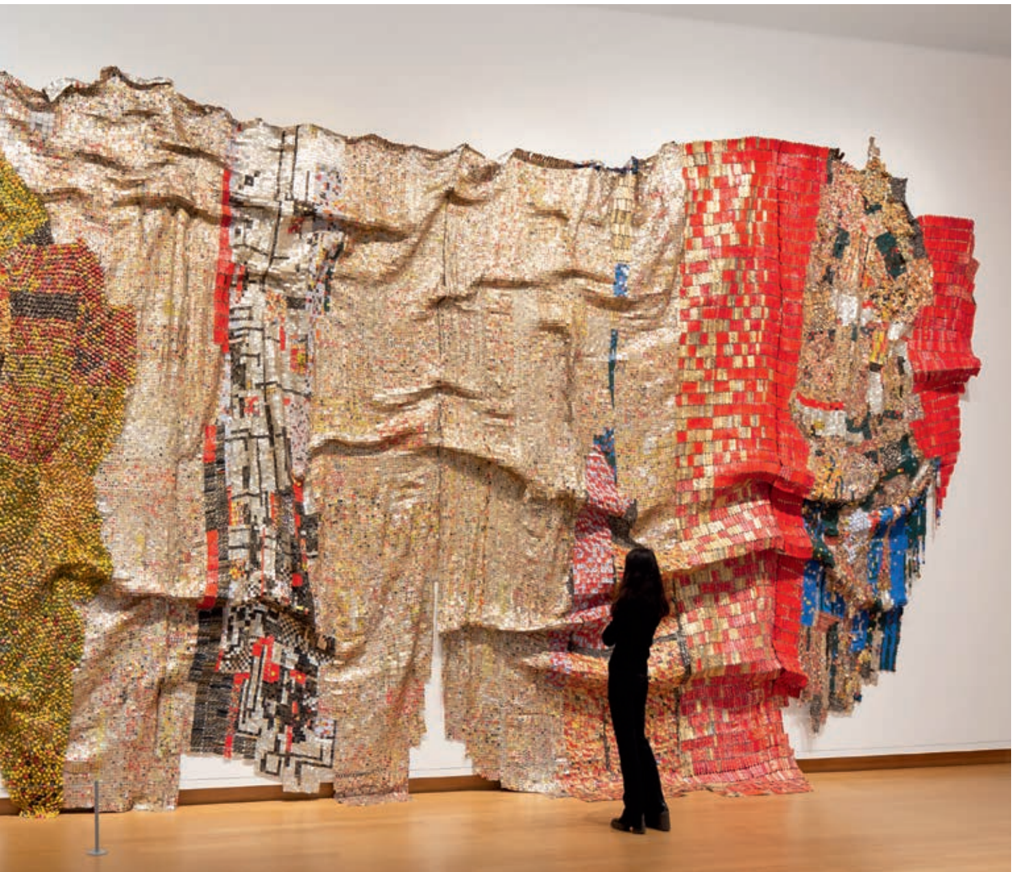
El Anatsui, In the World But Don't Know the World , 2009, collectie Stedelijk Museum Amsterdam en Kunstmuseum Bern, © El Anatsui