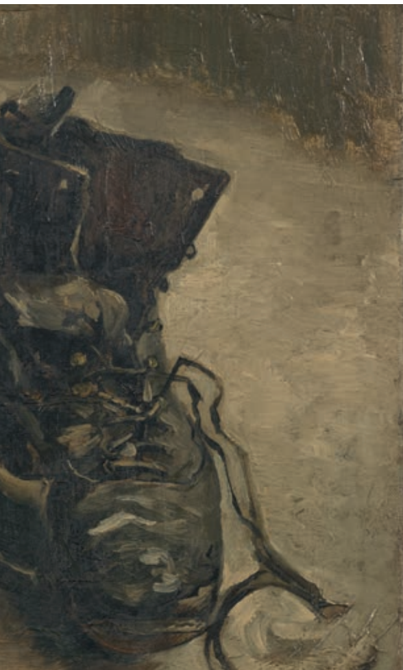
Vincent van Gogh, Schoenen , 1886, olieverf op doek, 38,1 cm x 45,3 cm. Van Gogh Museum, Amsterdam (Vincent van Gogh Stichting).